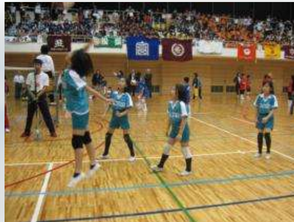
ビーチボールバレー大会